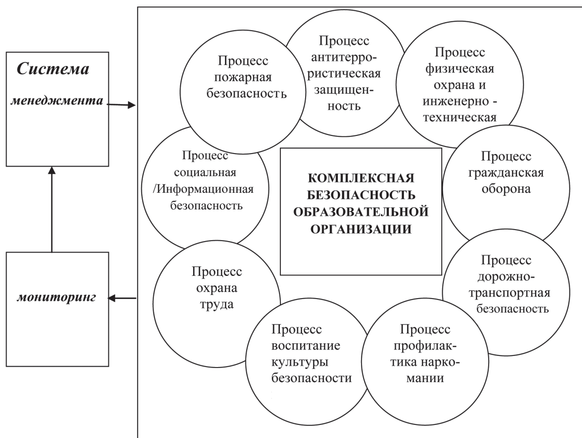
Рис.1. Динамическая модель управления комплексной безопасностью образовательных организаций

На основе процессного подхода нами была построена динамическая модель управления комплексной безопасностью образовательных организа-